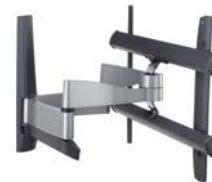
Dreh- und neigbare Plasma-Wandhalter