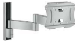
Dreh- und neigbare LCD-Wandhalter