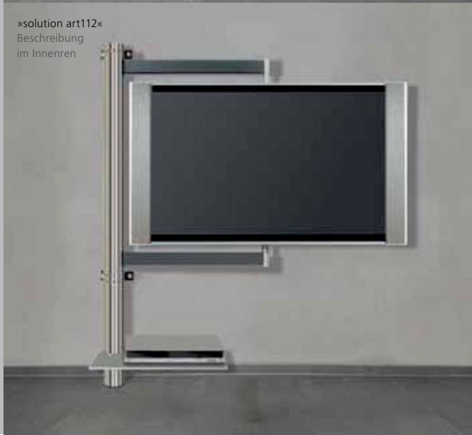
»solution art112« Beschreibung im Innenren