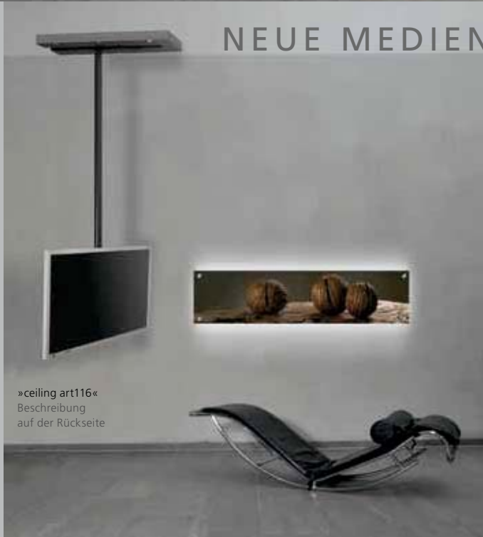
»ceiling art116« Beschreibung auf der Rückseite