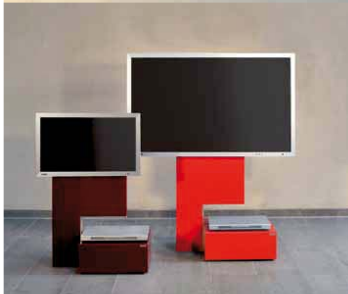
»move art115« Größe 1