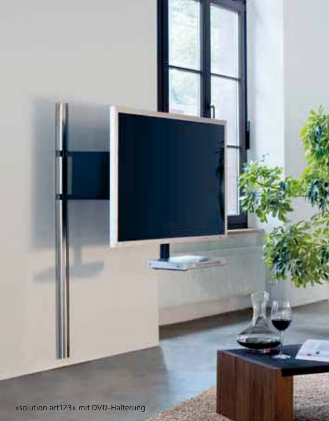
»solution art123« mit DVD-Halterung