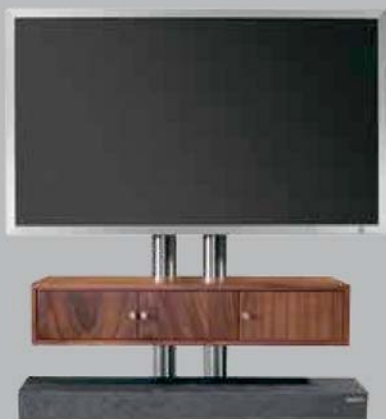
»twin art114« mit Unterschrank