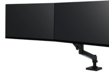
LX Pro Dual Direct