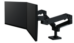
LX Pro Dual Side-By-Side