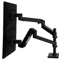
LX Pro Dual Stacking