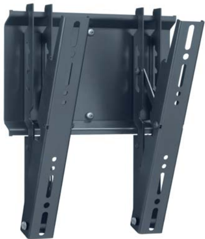
Bildschirm-Adapter PFI 3040